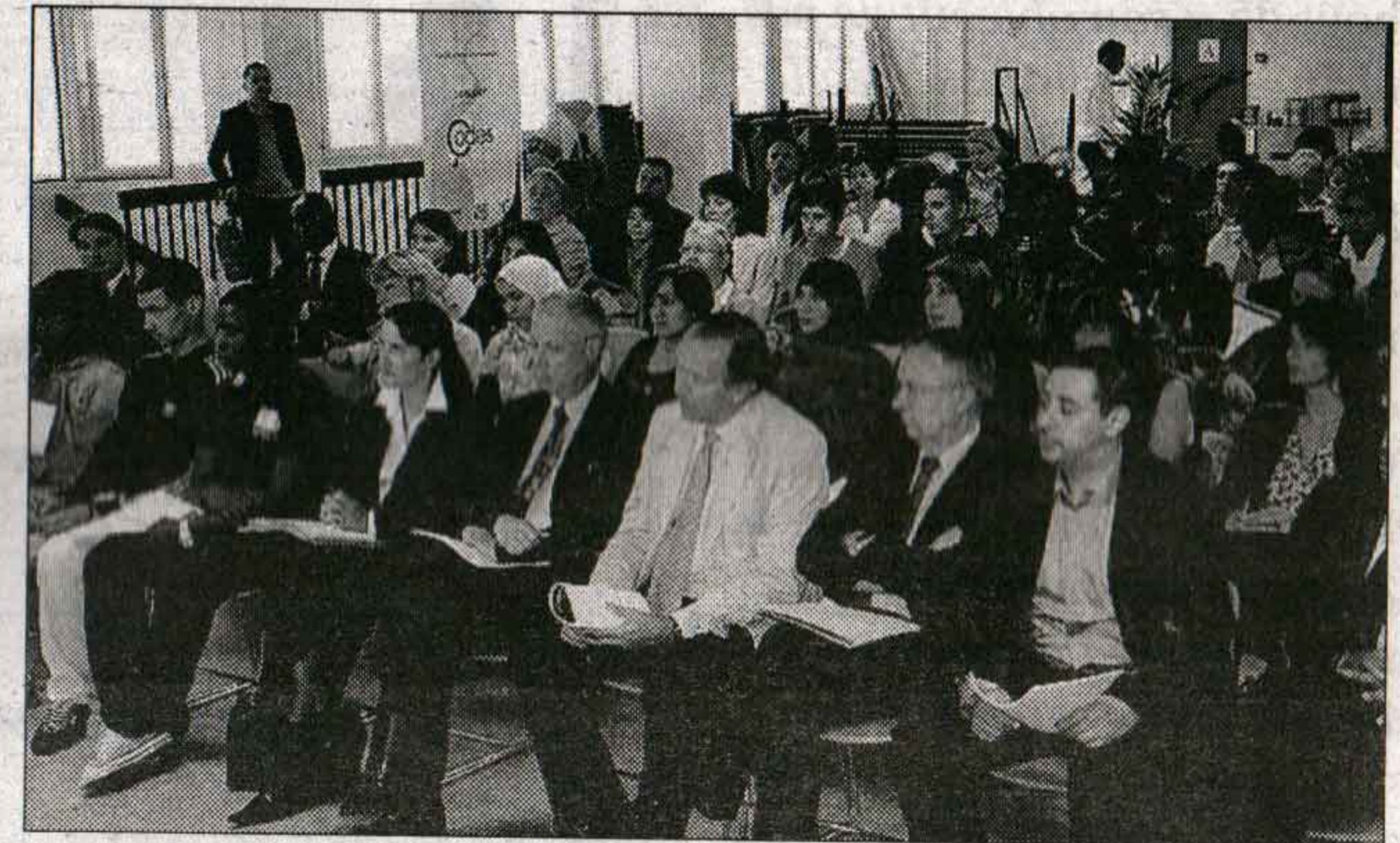
■ Le projet est né à l'initiative de la Mission Ville de la Préfecture.